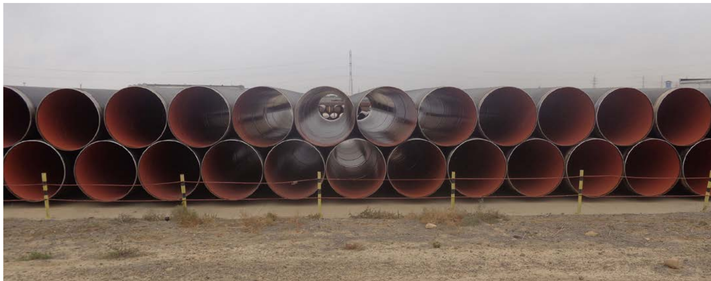
Трубы для проекта АО «ОзенМунайГаз»

АрселорМиттал Актау Волж су таратқышы мен Куелус-Меловая су таратқышы ойымдарын, сондай-ақ «Теңізшевройл» ЖШС болашақта кеңейту Жобасының қажеттілігі үшін жаңа өндірісті құруды қоса алғанда, аймақтың бірнеше құбыр жобаларына қатысу арқылы Маңғыстау облысы Әкімдігімен жемісті ынтымақтастықты бұдан әрі дамытуды жоспарлап отыр.