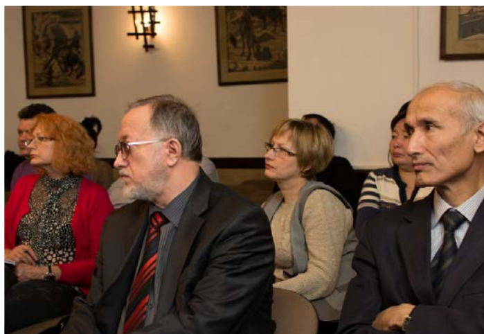
Бизнес-партнеры АрселорМиттал Ақтау