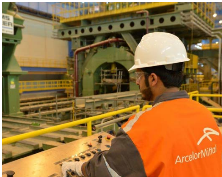
Оператор АрселорМиттал Джубаил проверяет процесс производства труб

Сауд Арабиясында орналасқан ArcelorMittal Tubular Products Джубаил мұнайгаз құбырларына арналған болат құбырлардың 5L-өндірісінің стандарты бойынша өндіріс талаптарының сәйкестігіне Америка Мұнай Институты (АМИ) аттестациядан сәтті өтті. Кәсіпорын ұжымының басқа да маңызды жетістігі жапсарсыз болат құбырлар өндірісін өнеркәсіптік сынауды бастау болды.